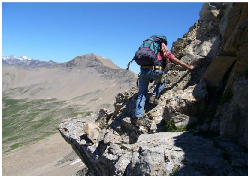
Une journée parfaite, au loin le Mourre Froid et le Pelvoux.

La montagne de Serre est d'une architecture particulière, elle est taillée dans des flyschs qui sont des roches où alternent le calcaire gréseux (solide) et marneux (pourri). En fait l'essentiel des roches de Réallon, à part Chabrières et un peu la Pusterle. Les bancs de marnes seront nos pires ennemis pour l'escalade, c'est une roche friable au possible et glissante aussi.