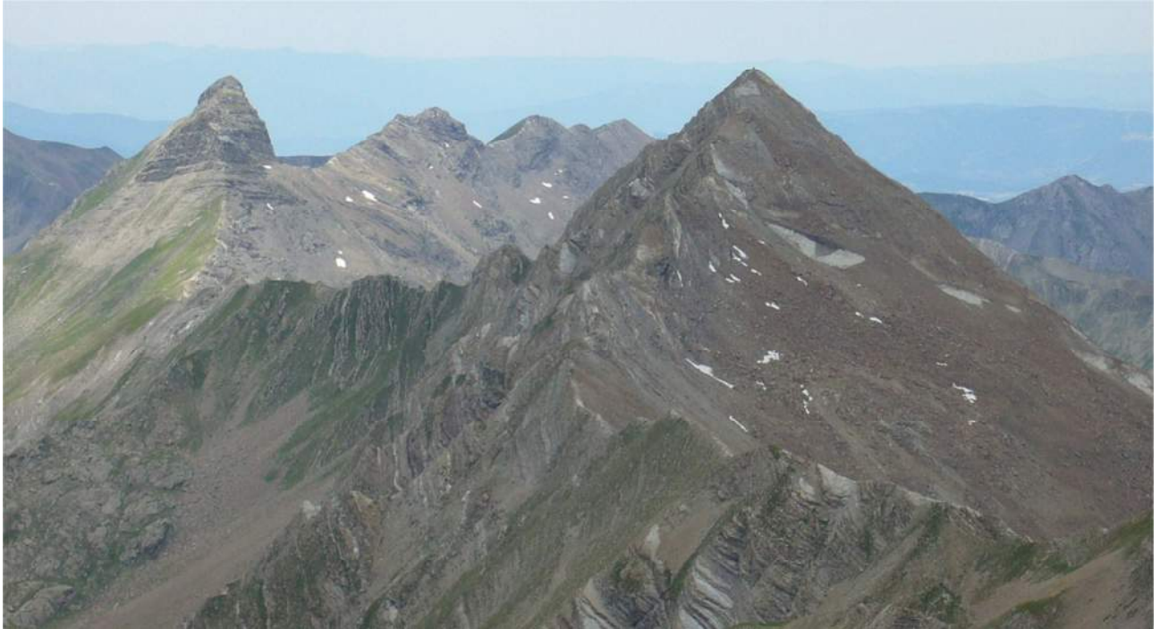
L'aiguille d'Orcière et le Barle depuis le Garabrut.

plus en plus! Ça n'en finit plus de monter et descendre sur cette crête de roche détritique. Il serait plus que temps de se trouver un coin quelque peu horizontal, ce qui semble, pour l'heure bien illusoire!