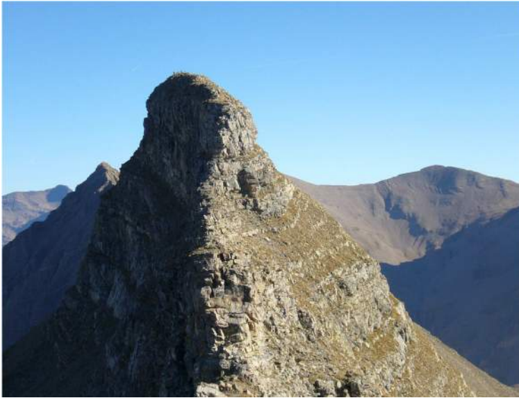
Le Barle 2733m

Arrivés au pied du Barle, on opte pour y monter directement par sa facette sud-est. Pour ce morceau, on sort la corde car ça devient de l'escalade, de la belle escalade sur un grès tout à fait correct. Après une longueur de trente mètres nous rejoignons le sommet, sans les deux chamois qui sentant notre présence, ne se sont pas fait prier pour détalé.