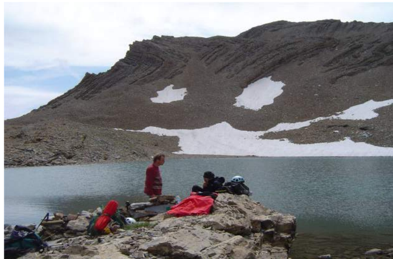
Sur les bords du lac Reyna, en médaillon la boîte que le renard a essayé d'ouvrir!