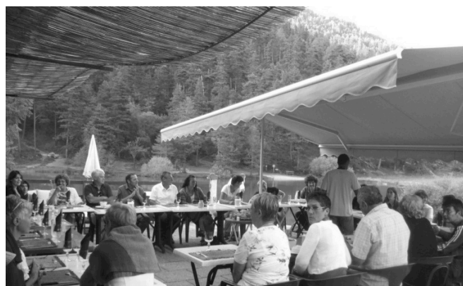
Repas de fin d'année au Chalet du Lac.

Sport Loisirs Embrunais : cs.bocquet@wanadoo.fr