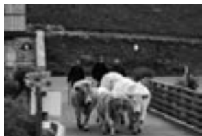
Foire aux bestiaux.

Tout ça nous amène à la foire qui s'est tenue le samedi 25 septembre. Une foire où les bêtes présentes étaient de qualité. Les maquignons savoyards ne s'y trompent pas puisqu'ils viennent régulièrement jusque chez nous.