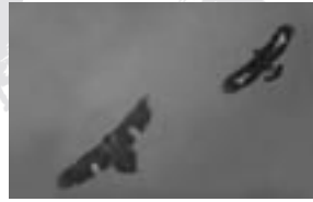
Gypaètes barbus au-dessus de Réallon.

L e mois de mai, sur le sentier de la Chapelle St Marcellin, un des jeunes du groupe que j'accompagnais me questionne sur le grand oiseau qui nous survole. Un regard suffit pour reconnaître la silhouette caractéristique d'un gypaète barbu!!!