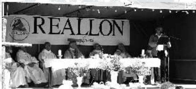
Fête inter-paroissiale des cantons d'Embrun et Savines.