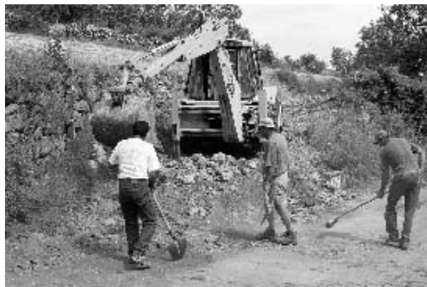
Les habitants et les employés communaux s'associent pour les travaux.

A l'occasion de la réfection du réseau d'eau potable et de l'enfouissement des réseaux électriques sur la partie « Est » du chef-lieu, un réseau d'irrigation des jardins a été mis en place à la demande des irrigants et avec leur participation financière d'une part mais aussi aux travaux d'autre part. La partie en rive gauche du torrent de la Pisse a été mise en service. Le matériel pour la rive droite a été commandé et sera mis en place à l'automne. ■