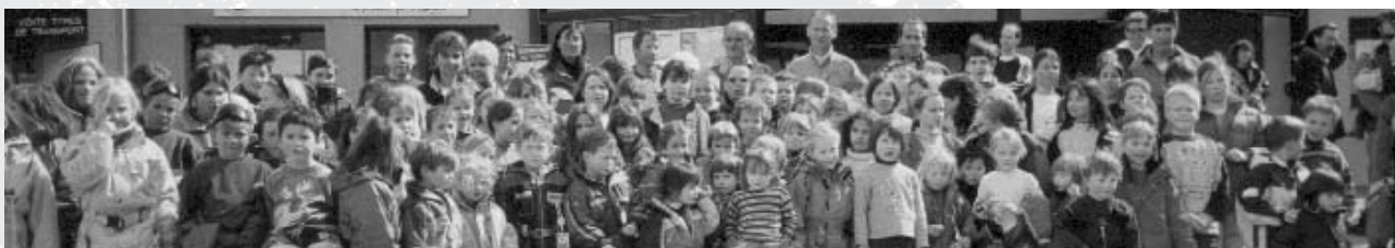
L'association Ski et Nature fête ses dix ans..