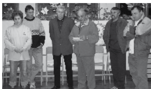
Soirée de présentation des vœux du Maire.