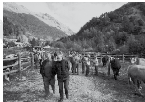
Une foire au bestiaux dans la tradition.