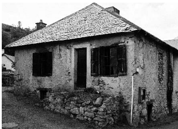
Le Four des Rousses après travaux de renforcement.

Conscient du patrimoine que représentent les fours de Réallon et des Rousses, les habitants ont annoncé, lors des rencontres avec la municipalité organisées par hameau, qu'ils tenaient à leur réhabilitation. Les habitants des Rousses se sont proposés à la fois pour aider aux travaux de démolition partielle le temps venu et pour contribuer financièrement par des souscriptions. La commune a entamé des recherches sur la procédure de sections de communes et elle a recruté un architecte du patrimoine qui travaille au diagnostic du four des Rousses et aux préconisations de travaux. Les employés de la commune ont donc procédé à l'arrêt des principales dégradations sur le four des Rousses en renforçant la charpente et la toiture. ■