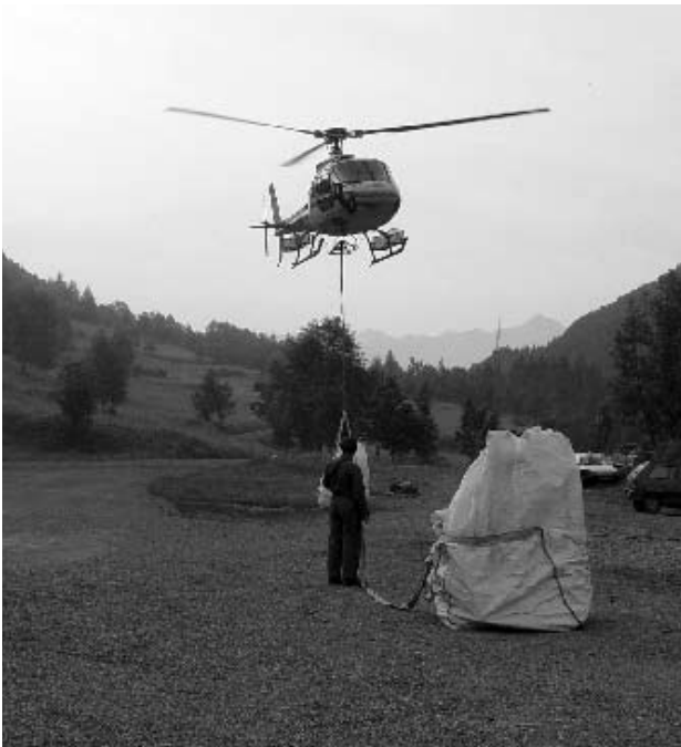
Héliportage du sel.

Le Groupement Pastoral de Chargés assure donc à présent la gérance de l'alpage. L'héliportage du matériel, du sel, d'une partie du ravitaillement du berger, du recrutement de celui-ci, le règlement sanitaire des animaux font partie des préoccupations de tous les adhérents.